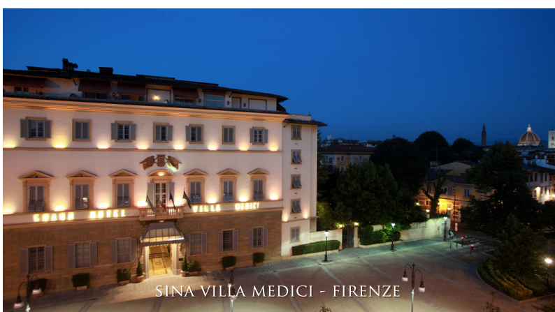
SINA VILLA MEDICI - FIRENZE