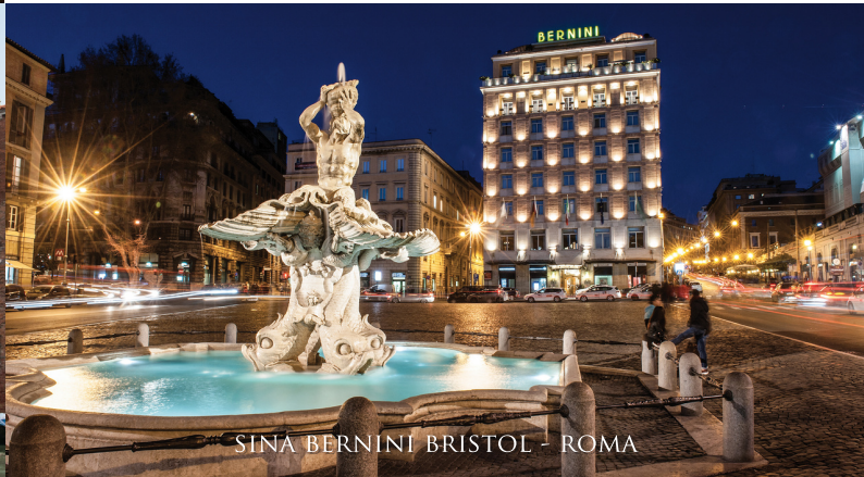
SINA BERNINI BRISTOL - ROMA