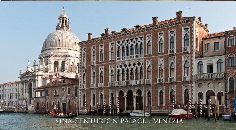
SINA CENTURION PALACE - VENEZIA