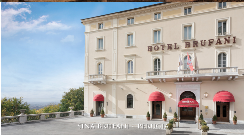
SINA BRUFANI - PERUGIA